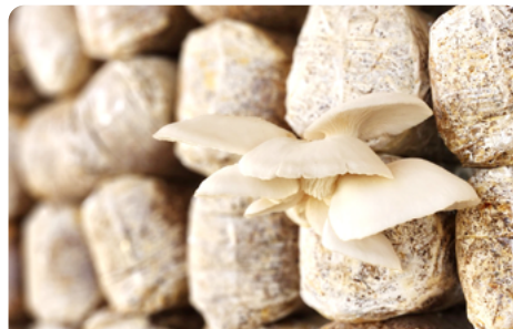
버섯 생산을 위한 버섯 백