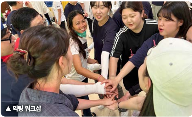
▲ 익팅 워크샵

▶ 자립선교체험(농업, 양계) 및 강의, 지역교회 및 학교 어린이 사역, 가정방문, 소수민족 마을 홈스테이, 여성일자리 사역 워크샵 등