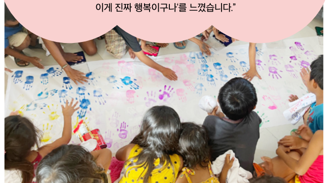
마뭇교회 어린이 사역

"어린이 사역을 마친 후 이동하려고 하는 찰나에 아이들이 뛰어나와 우리에게 편지 한 장씩을 주었는데, 그 종이엔 'Thank you. Take care and God Bless you'라고 적혀있었습니다. 서툰 글씨로 쓴 편지였기에 더욱 큰 감동을 받았고 굿바이 인사를 할 때 먼저 다가가 안아주는 순간 울컥하며 '이게 진짜 사랑이구나, 이게 진짜 행복이구나'를 느꼈습니다."