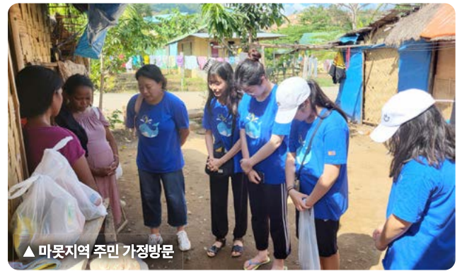
▲ 마웃지역 주민 가정방문