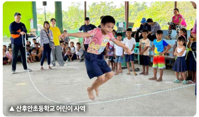
▲ 산후안초등학교 어린이 사역