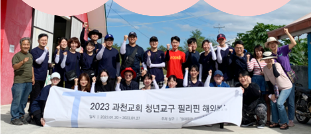
과천교회 청년교구 필리핀 해외봉사팀

"익팅 봉제센터에서 일하시는 어머니들과의 교제와 나눔 시간이 가장 기억에 남습니다. 어머니 한 분이 처음 매니저직을 맡아 달라고 요청이 왔을 때 못하겠다고 하다가 이 자리를 놓고 진정으로 하나님께 기도드렸다는 말씀을 해주셨습니다. 이 이야기를 듣고, 나는 앞으로의 미래에 대한 고민을 하나님께 진정 기도로 질문하지 않았다는 걸 깨달았습니다. 해외봉사를 간 건 나인데 오히려 제가 더 많은 것을 얻고 하나님의 사랑을 많이 받은 시간이었습니다."