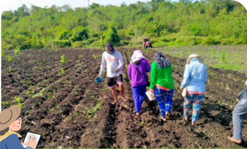
콩 농사 모니터링

이에 캠프는 23년 4월 3일, 쇼케이스 및 농업부와의 MOU(업무협약) 체결식을 진행하여 정부 관계자 및 지역 농민들에게 콩 농사 현황 및 이점을 알리고 농업부와의 협업을 더욱 강화할 예정입니다.