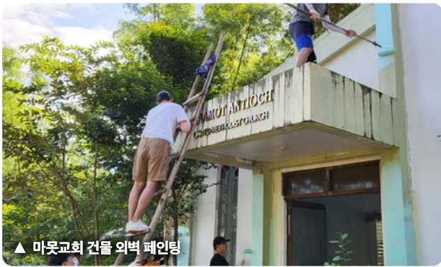
▲ 마웃교회 건물 외벽 페인팅

▶ 자립선교체험(농업, 양계) 및 강의, 지역교회 및 학교 어린이 사역, 가정방문, 길거리 전도, 수요예배, 나눔 등