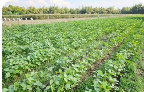
콩 농사 시범농장