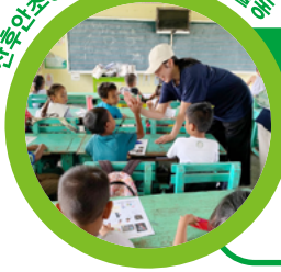
산후안초등학교 문화교류 봉사활동

지난 1월 15일부터 21일까지 충남대학교 사회공헌센터와 캠프가 함께한 '대전 학생네트워크 글로벌협력 프로젝트'의 IDC(International Development Cooperation) 연합동아리 소속 12명의 학생들이 캠프의 필리핀 현장을 찾았습니다. 참가 학생들은 국내에서 20시간이 넘는 사전교육으로 PDM 작성법 및 실습, 현지문화이해교육, 현지조사방법론을 수강했고, 5박 6일 동안의 필드트립은 타워빌, 딸락, 마닐라 세 지역에서 진행되었습니다.