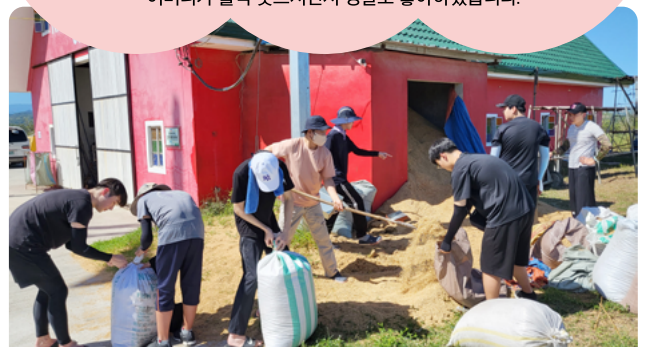
자립선교 농업봉사 활동

"가정방문으로 자녀가 6명인 어머니를 만났습니다. 자녀들이 줄을 서 우리를 바라보았습니다. 한참 이야기를 나누다가 기도 제목이 무엇이나고 질문하자 어머니가 울먹이는 목소리로 형편이 나아지는 것이라고 말했습니다. 준비한 식품과 선물을 드리며 말했습니다. '이 선물은 아주 작지만 하나님이 어머니의 가정을 부요하게 하실 것이고 자녀들에게 복을 주실 것이니 하나님을 믿고 힘내세요.' 어머니가 활짝 웃으면서 정말로 좋아하셨습니다."