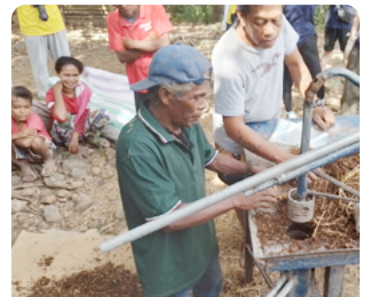
버섯생산 기술 전수