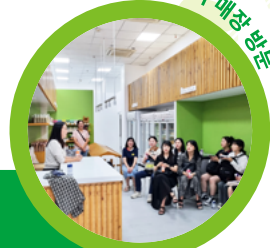
올가 매장 방문