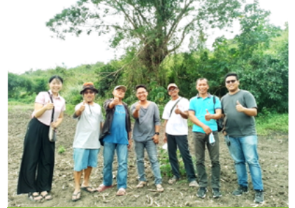
콩 농사를 함께하는 협력 농민들