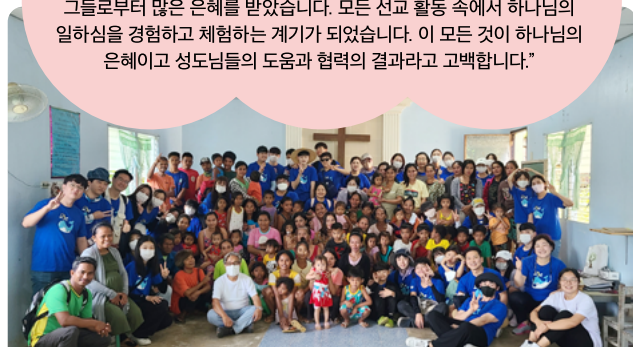
구하리교회 세대통합 비전트립팀

"어려운 여건과 환경 속에서도 딸락 지역 어린이들로부터 어른들에게 이르기까지 표정이 매우 밝고 순수하다는 생각을 하며 그들로부터 많은 은혜를 받았습니다. 모든 선교 활동 속에서 하나님의 일하심을 경험하고 체험하는 계기가 되었습니다. 이 모든 것이 하나님의 은혜이고 성도님들의 도움과 협력의 결과라고 고백합니다."