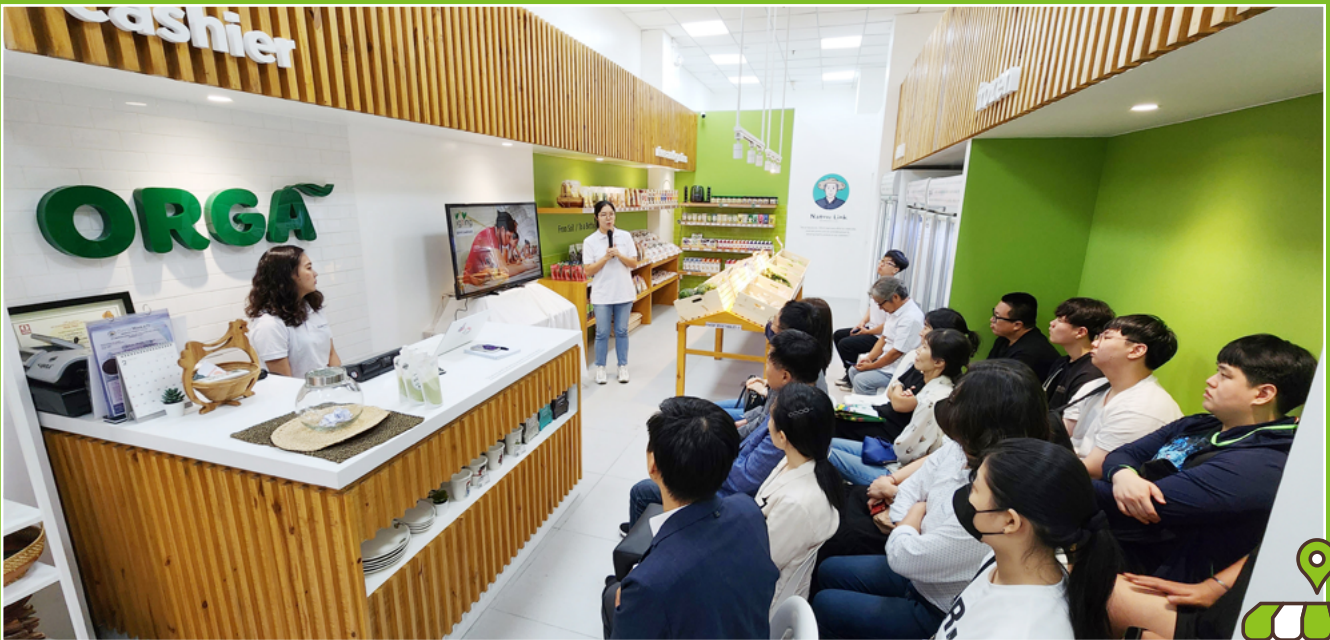
▲ 올가 매장 확장 이전 행사