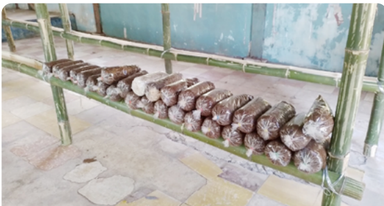
버섯 시범농장 생산시설

지역주민들은 버섯 생산기술 훈련과정에서 직접 버섯 생산 백을 만들어 기뻐했습니다. 앞으로 소수민족 마을에서 생산될 버섯이 지역의 경제를 활성화할 것을 기대합니다.