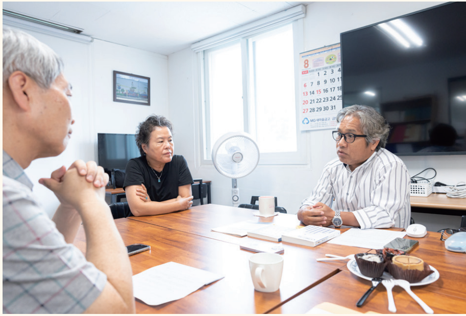
△ 사진 가운데, 사단법인 캠프 양미강 운영위원장

Q. 위축되었다고 하시지만, 제가 보기에는 거버넌스가 올바른 방향으로 나아가고 있는 것 같습니다. 후원이사회로 시작하여 실무형 이사회를 거쳐 보다 전문적인 이사회로 전환하는 단계에 있는 것 같은데, 두 번째 단계로 넘어가지 못하는 단체들이 대다수예요. 그런 점에서 볼 때 이미 잘 하고 계신 것 같습니다.